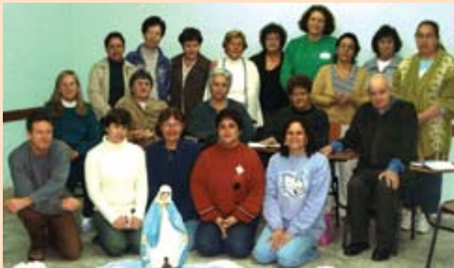
Representantes das comunidades e pastorais que formam a Eq. Litúrgica da Paróquia